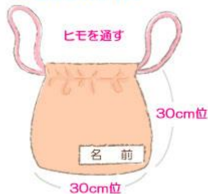
★着替え袋の作り方